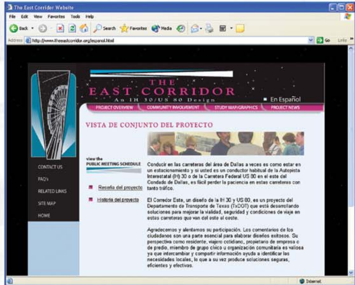
The East Corridor página de inicio del sitio Web

The East Corridor c/o Melissa Wolff, HNTB 701 Commerce St., Suite 700 Dallas, TX 75202