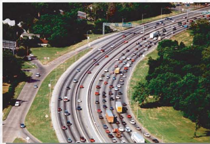
Congestión de tráfico en la carretera interestatal 30